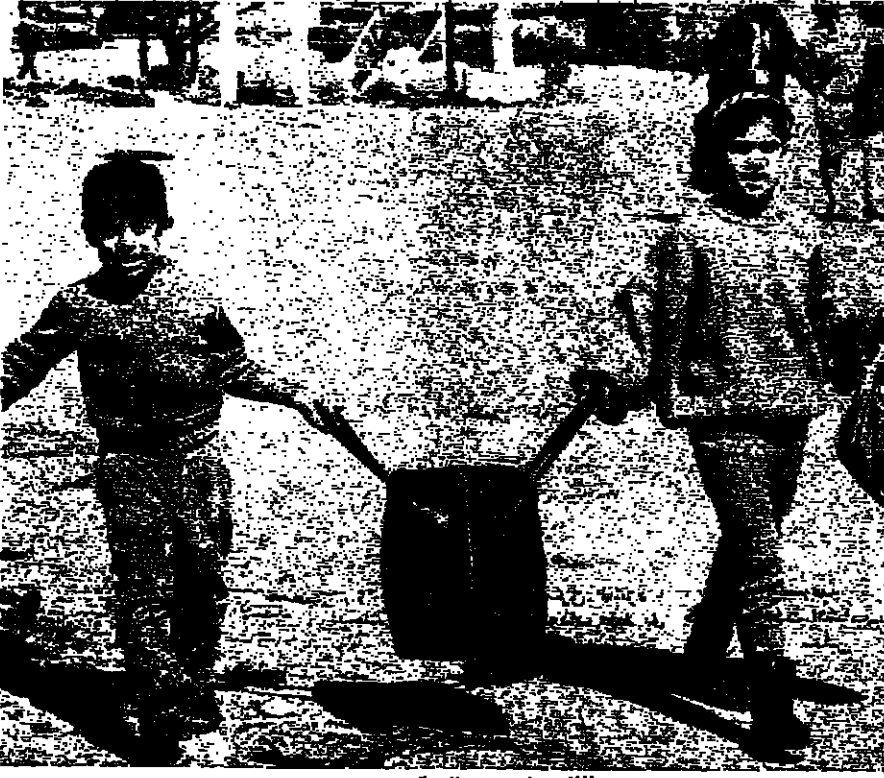
طفلان على معبر الصالومي